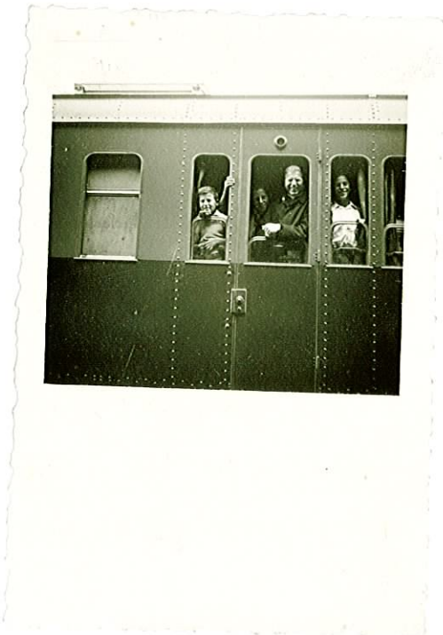
Giovani ferroviaria M